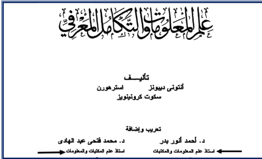
شكل رقم (٥) يبين نموذج صياغة اللقب العلمي للمؤلفين العرب.