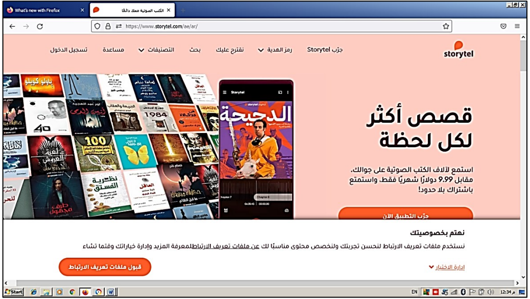
شكل ( ١ ) عرض صفحة تطبيق Storytel

ففي بداية الصفحة الرئيسية للتطبيق تُعرض صفحات فرعية بالعناوين (جرب Storytel - رمز الهدية - نقترح عليك- بحث- التصنيفات- مساعدة- تسجيل الدخول)، وعند الانتقال للصفحة الفرعية "بحث" وكتابة عنوان العمل في خانة البحث يأتي بصفحة تتضمن في أعلى اليمين عنوان العمل يتبعه نجوم خمسة لتقييم العمل من جانب القراء يلي ذلك اسم المؤلف ثم اسم الراوي، يُتبع بنبذة عن موضوع العمل تتضمن مقدمة تمهيدية مشوقة تهدف إلى جذب الانتباه للاستماع إليه و أهم الأفكار المتضمنة، ثم يأتي على يسار الصفحة تصنيف موضوعي للعمل من وجهة نظر المُعد، وفي أسفل اليمين نجد عرض لمزيد من المعلومات عن دار النشر وتاريخ الإصدار والمدة الزمنية التي يستغرقها العمل في العرض وما يتعلق بالترقيم الدولي، ومن الجدير بالذكر وجود نقاط إتاحة بحثية تتيح عرض أعمال أخرى ذات علاقة مثال أعمال مؤلف معين أو نفس الراوي أو إصدارات نفس الناشر أو تلك التي تتشابه مع العمل المعروف في موضوعه، ومن أهم الخدمات التي يقدمها التطبيق هي "الإبلاغ عن المشكلة" وذلك في حالة مواجهة المستخدم أي عقبات أو صعوبات، وأيضاً تقديم عينة مجانية من العمل يتاح الاستماع إليها وتجربتها والاستفادة منها قبل الإقبال على شراء العمل، ومن العيوب التي اتضحت عند البحث على Storytel أنه يتطلب الالتزام بالكلمات المفتاحية والتي يقصد بها عنوان العمل كما هو مسجل على قاعدة بيانات الموقع مع الالتزام بالمسافات والهمزات و الباء المنقوطة وغيرها ؛ فالموقع لا يقدم عرض للعمل المطلوب إلا إذا تم استدعاؤه في نفس الشكل الذي تم تسجيله به.